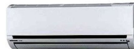
省エネエアコン エアコン新品 & 省エネで人気物件へ