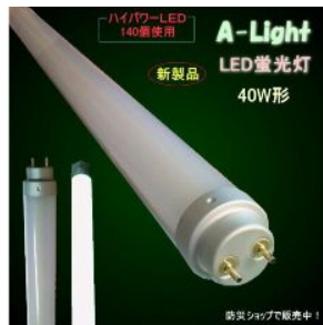
LED蛍光灯 共用部の電灯 を交換