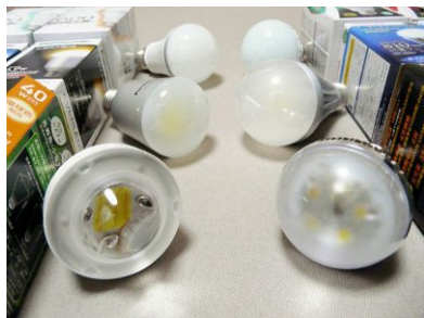
LED電球(ダウンライトや電球タイプ)