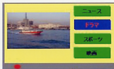
画面上で番組選択・ 番組情報の検索も