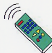
リモコン操作でらくらく