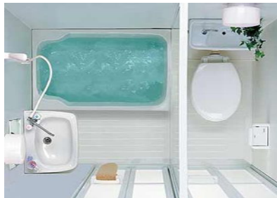
1116サイズ 577,500 円(消費税込)