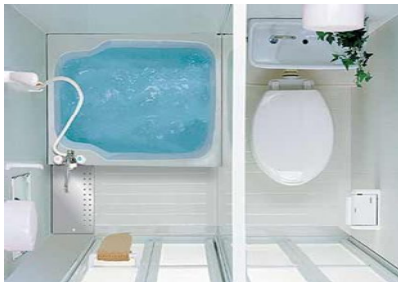
1014サイズ 472,500 円(消費税込)