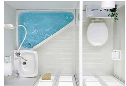
1216サイズ 577,500 円(消費税込)

3点ユニットバス物件の家主様に朗報です。 今の大きさを変えずに、3点ユニットバスを バス・トイレセパレートにできる商品がで きました。