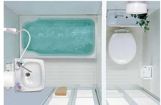
バス・トイレセパレートへ