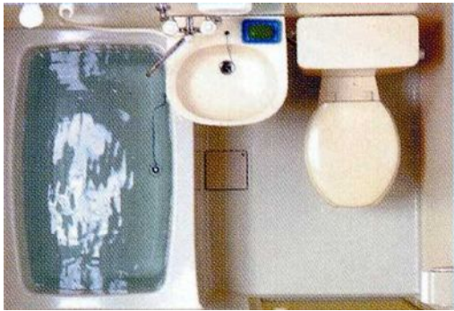
1216サイズ3点ユニットバス